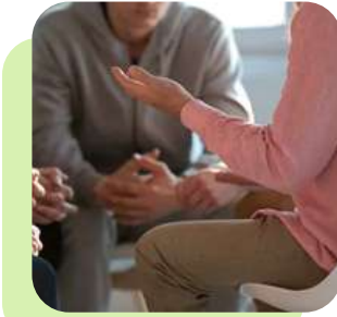
Groupes de parole