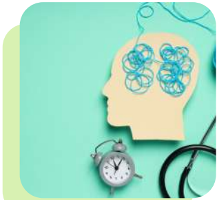
Comprendre les pathologies